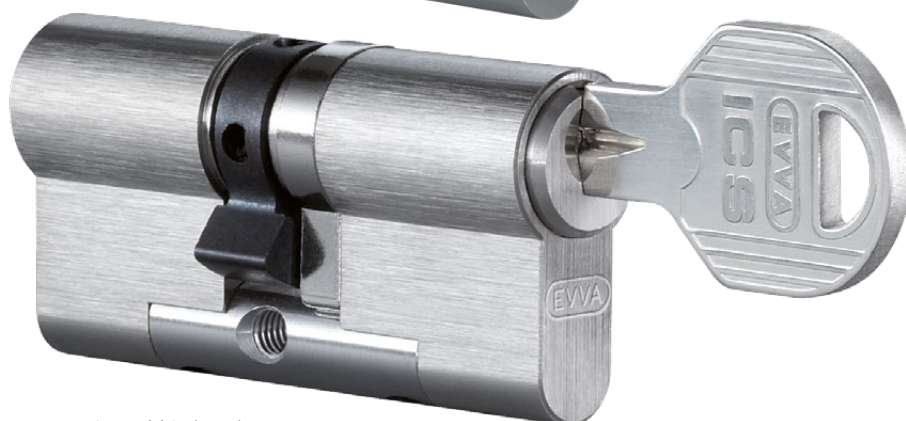
Conception modulaire (SYMO)