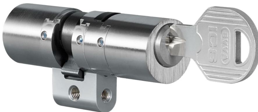
Profil rond (SYMO)